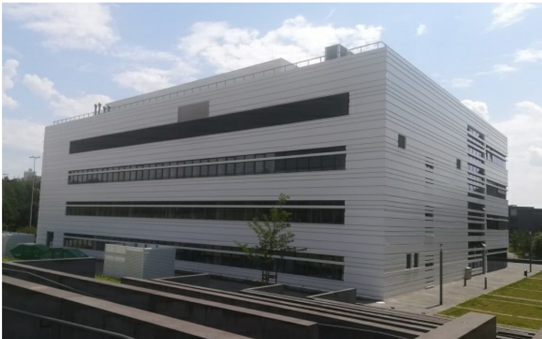
Das Zentrum für molekulare Protein-Diagnostik - ProDi.